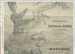
石狩川生振捷水路 北海道石狩川図