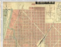
帯広市都市計画 帯広市明細図