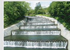
奥沢水源地水道施設