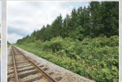
宗谷線鉄道防雪林 深川林地