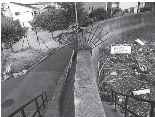
写真4 堤防(写真中央)の左側が堤内の住宅地、右側の堤外地には流木が集積