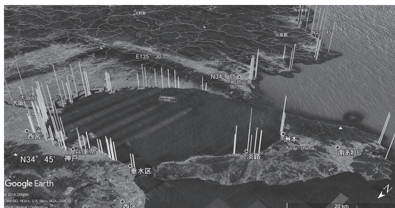
図1 調査結果に基づく浸水高の空間分布(高潮偏差、高潮偏差+波浪影響)

今回の台風21号は、発達時こそ伊勢湾台風とよく似た発達をしたものの、北緯20度以北では過去の3台風と比較すると早い段階で勢力を弱め始めている(図2)。北緯33度における各台風の中心気圧を比較すると、室戸台風が911hPa、伊勢湾台風が927hPa、第二室戸台風が924hPa、台風21号が947hPaであ