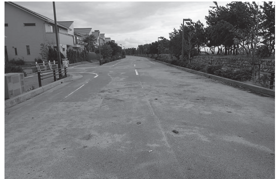
写真1 芦屋市涼風町における越波浸水