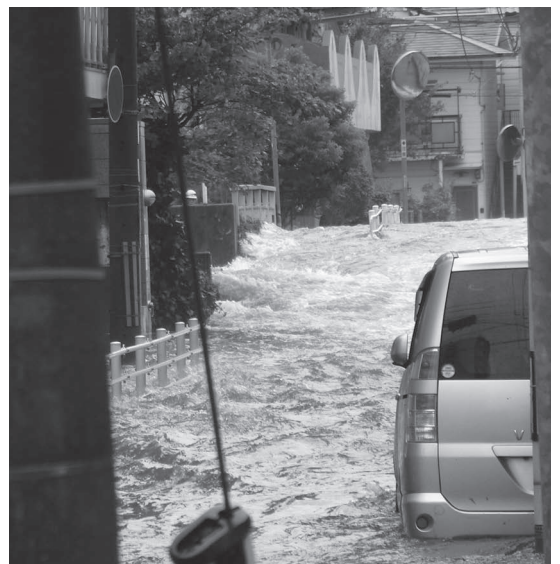
写真2 高橋川深江橋付近の氾濫状況

六甲アイランド東側では、浸水深約2mにもおよぶ高潮と波浪により、甚大な被害が発生した。コンテナターミナルでは、多数のコンテナが漂流したほか、電源設備が浸水したことにより、ガントリークレーン等が使用できなくなった。写真3はコンテナの漂流状況であり、ドローンにより撮影したものである。高潮