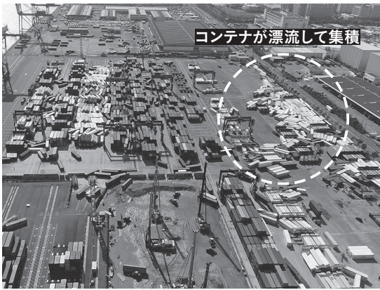
写真3 コンテナの散乱(六甲アイランド東)