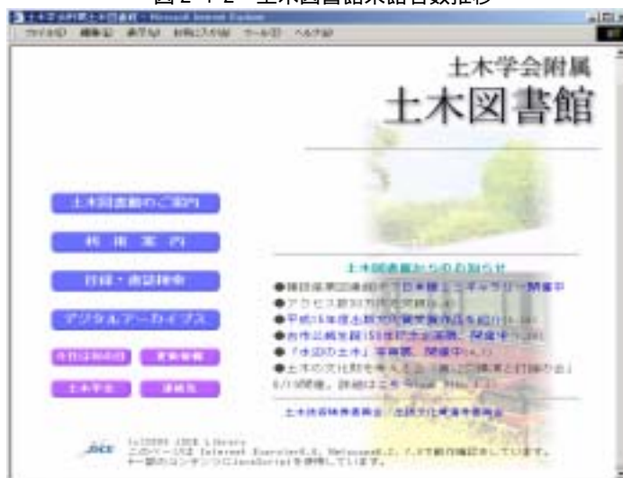
図2-4-3 土木図書館 HP トップページイメージ