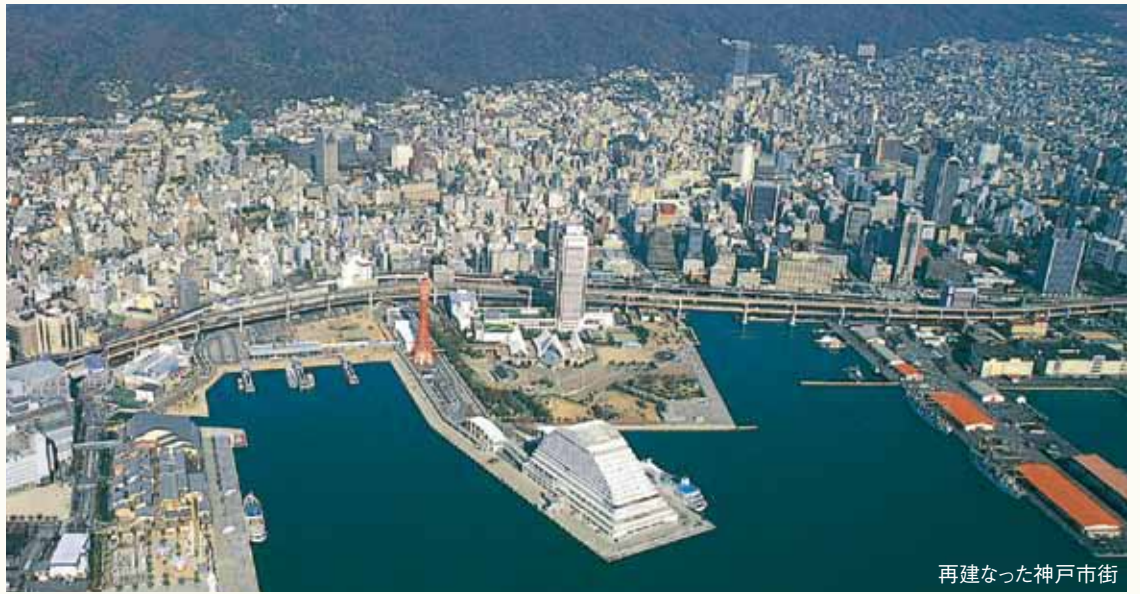
再建なった神戸市街