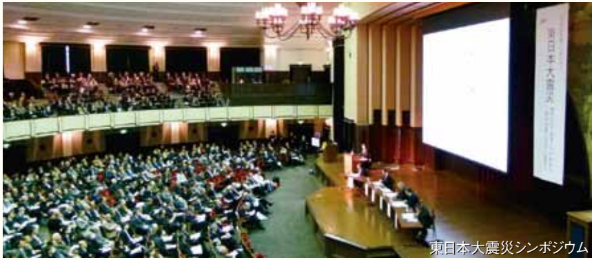
東日本大震災シンポジウム