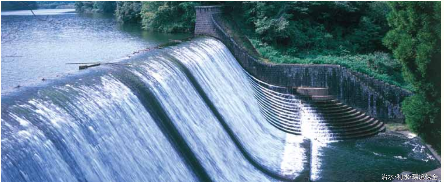
治水・利水・環境保全