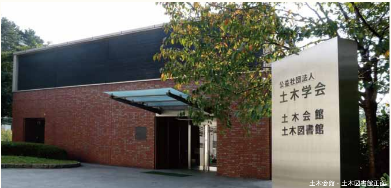
土木会館・土木図書館正面