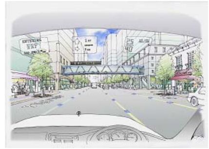
図-7 動的レーン運用

交通渋滞は、ビジネス機会の逸失、燃費の悪化による CO 2 排出量の増加、NO x や PM 等の大気汚染物質の増加等、多くの社会問題の一因となっている。その解決策については、当初は道路建設による容量拡大が主であったが、それと並行して、既設道路でも交通管制を高度化し容量を管理するシステムが導入され、各種 TDM により需要を時空間的に分散するための施策が実施されるなど、道路空間の運用を効率化する取り組みが行われてきたが、依然として渋滞問題は解決していない。