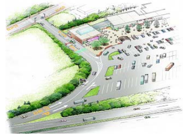
図-6 スマート IC

また、既存道路の有効利用には、鉄道等公共交通との連携が重要であるが、その鍵を握るのが駅前広場である。我が国には乗降客が 5,000 人/日以上 of 駅が全国に 2,400 箇所あり、それらのうち 20~30% の駅前広場は、面積確保が困難であるため、駅前広場としての機能及び規模とも十分ではない状況となっている。しかし、今から新たな用地を確保し、交通空間及び環境空間を整備することは現実的ではない。例えばタクシーやバス等の待機スペースを、ITS を用いて分散的に確保できれば、駅前広場を効率的に運用できる(分散型駅前広場)。