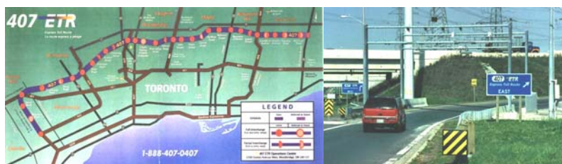
図-5 ETR407 (トロント) におけるフリースルー

ただし、ITS の実践を目指す上で、種々の現行 ITS 関連法制度の限界が、利用者に大きな損失をもたらすことがまさに懸念されている。新たなコンセプトを効果的に実現するために、ITS を推進する関係省庁が一致団結して障害を取り除く努力を怠るべきでない。必要に応じて、制約となっている法制度については柔軟に見直していくことが必要である。