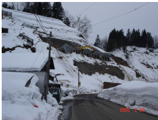
図-1 国道 291 号(県管理)小千谷市浦柄付近積雪期に応急復旧作業中(2005 年 2 月 24 日)

我が国における防災に関係する研究や技術は世界的に見てもトップクラスであり、防災に係る ITS の分野においても広く内外にアピールし、災害が頻発しているアジア地域に対し、その国の状況を認識したうえで、提案・展開して行く必要があると考える。