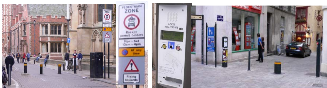
図-2 Cambridge での歩行者エリアの事例(左)と Nantes での事例(右)